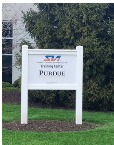
スバル・オブ・インディアナ・オート内にあるパデュー大学の分校