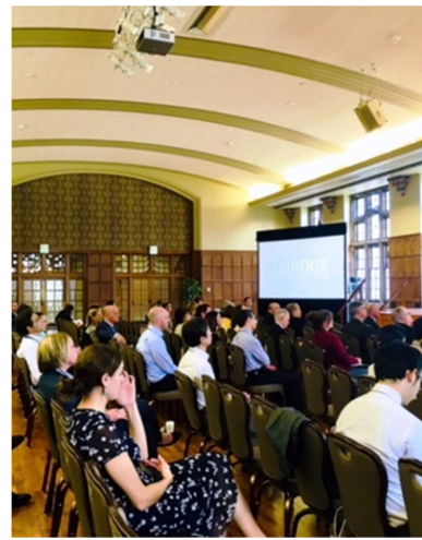
セミナー会場の様子